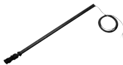
BORULU SEVİYE PROBU